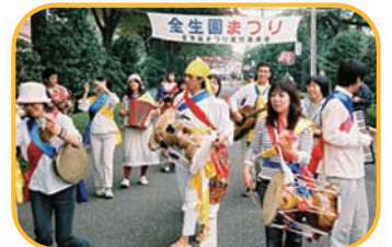
全生園まつりの様子

園の恒例行事として、観桜会、納涼会、多磨全生園まつりなど各種レクリエーションを開催しています。変化の少ない療養所の生活に潤いと活力が生まれ、入所者のみなさんが、楽しみにしています。