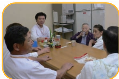
入所者を交えての語り