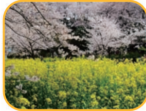
園内の桜と、秋の紅葉は見事！