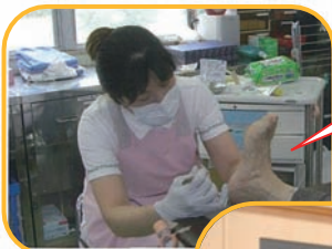
フットケア中 (外科外来)