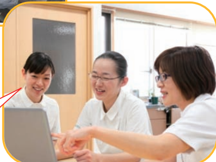
なかなかいいアイデアですね！