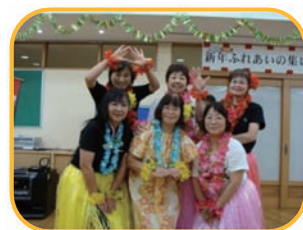
新年ふれあいの集い

変化の少ない療養所の生活に潤いと活力が生まれ、入所者の皆さんのみならず、職員もみんな楽しみにしています。