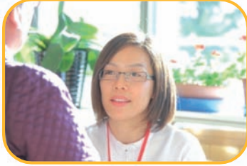
「調子はいかがですか」