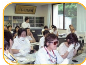
医療安全体験学習会