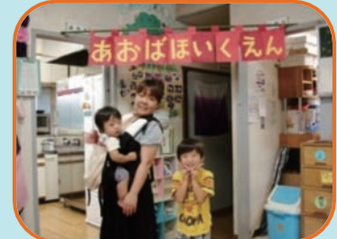
ゆとりを持って迎えに行けるので、長男も嬉しそうです。