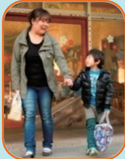
息子2人をバスに乗って連れて行きます