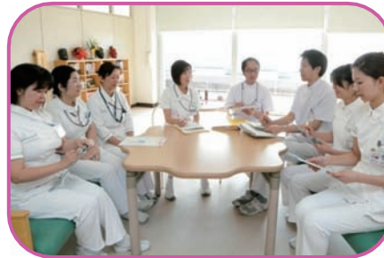
チームカンファレンスの様子