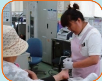
スタッフも明るく、活気ある職場です♪