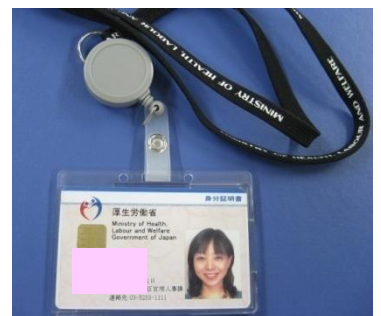
<厚労省職員の証。身分証明書>