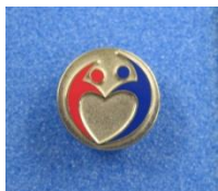
<厚労省職員のバッジ>

看護技官は毎年のように増員が行われており、配置される部署も拡大しています。このような行政の仕事を看護技官の一員として、国民が求める看護の仕組みをつくるために一緒に働いてみませんか。