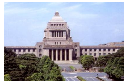
国会議事堂 何度も通います

特に戦略型研究は、慢性疾患・健康障害を標的とし、その予防・治療介入及び診療の質改善等、行政施策に直結した成果を各所管課とともにめざす大規模な臨床介入研究であり、我が国の臨床研究の質の向上を図るチャレンジングな試みを行っています。