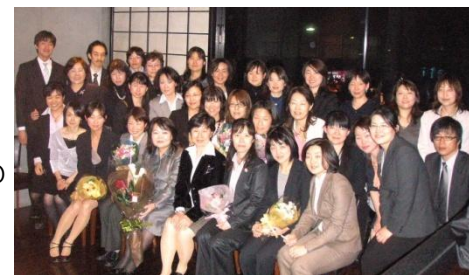
看護技官の懇親会も年に数回開催

看護技官全体の勉強会はほぼ月1回開催しており、歓送迎会等も定期的に開催しています。課によっては、看護技官の1人配置もあるので、看護技官同士の「横のネットワーク」は大切にしています。