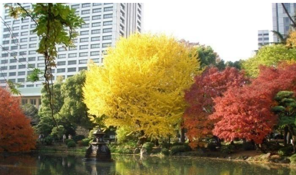
日比谷公園では四季を実感できます（写真のバックは厚労省）

看護技官は、これら業務のうち主に介護予防と介護報酬の訪問看護・療養通所介護等に関する業務を担当し、制度の運営及び改定等に係る技術的視点からの企画提案・助言、自治体及び関係機関職員等に対する制度説明のための全国規模での研修・会議等の企画運営、介護報酬上の技術評価に資する研究調査事業の企画・審査等に従事しています。