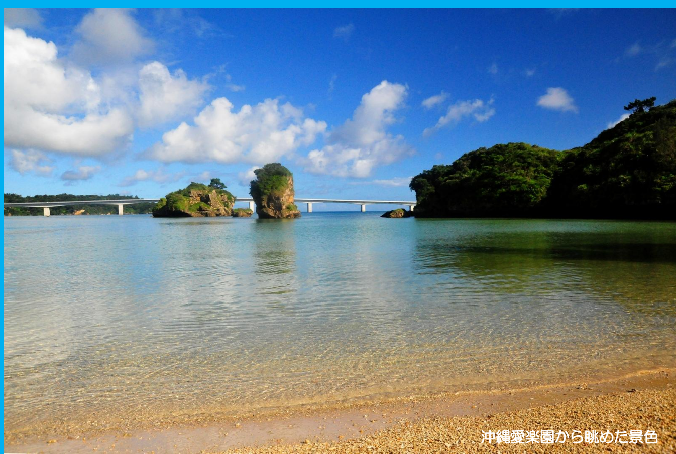
沖縄愛楽園から眺めた景色