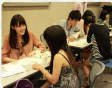
中学生を対象とした勉強会(若者すだち支援事業)