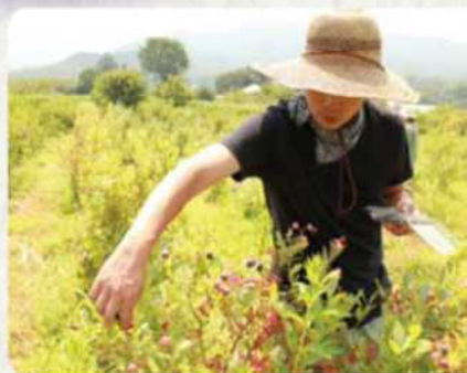
NPOが借りている農場で農業体験