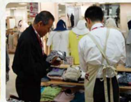
市内企業での就労体験