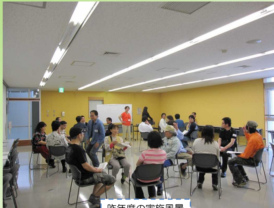
昨年度の実施風景

この就労体験・社会参加等支援事業は相模原市がテンブスタッフ㈱に委託して実施するものです 20