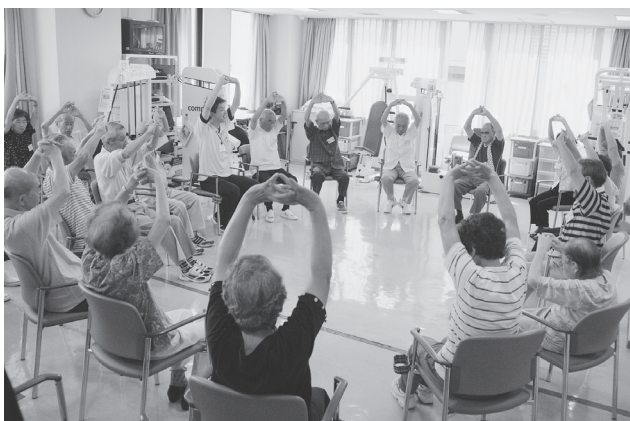
円形になって準備体操