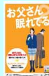
広報啓発用ポスター