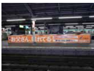
ホーム腰壁シート