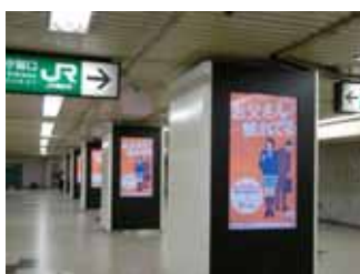
デジタルポスター