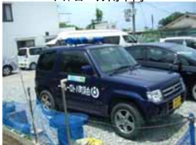
パトロール用車両