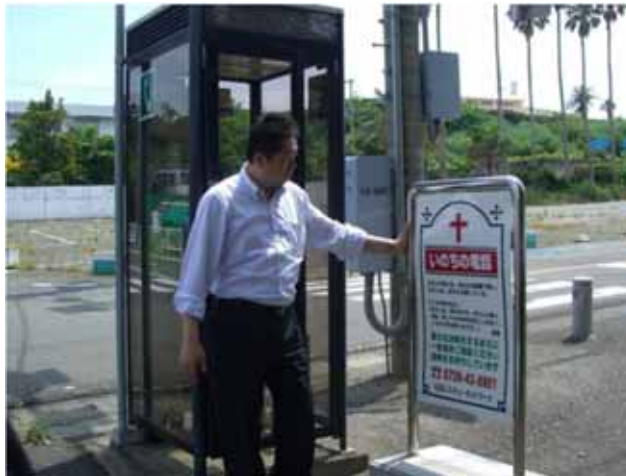
支援を求める人への「いのちの電話」の看板