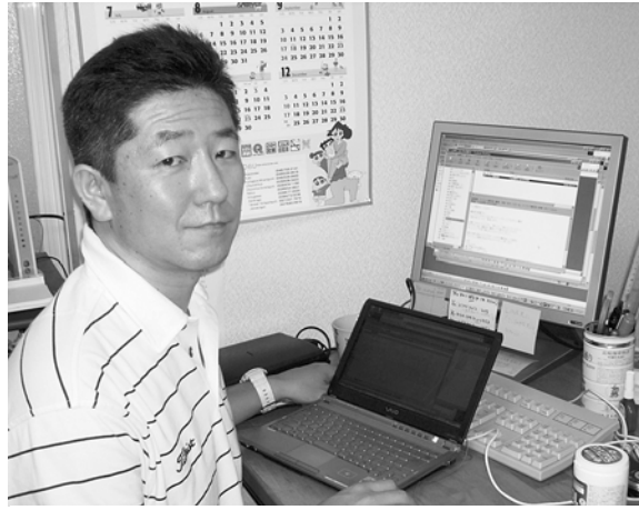
さすがITエンジニア。パソコン2台駆使など朝飯前

ライフリンクに入って最初に手がけたのはサーバーの移設。それに引き続いて今年の春先にはホームページを刷新するプロジェクトを手がけました。エンジニアではあったものの、かなり苦戦?を強いられました。