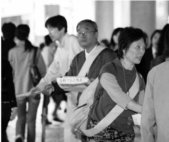
5月13日の全国一斉署名活動は雨の中。東京・新宿西口で