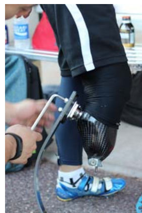
図 4 義足長調整風景