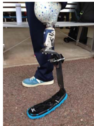
図 2 装着風景