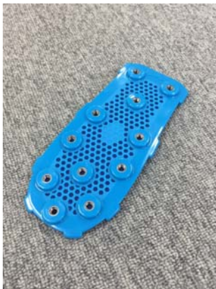
図7 スパイクカバー