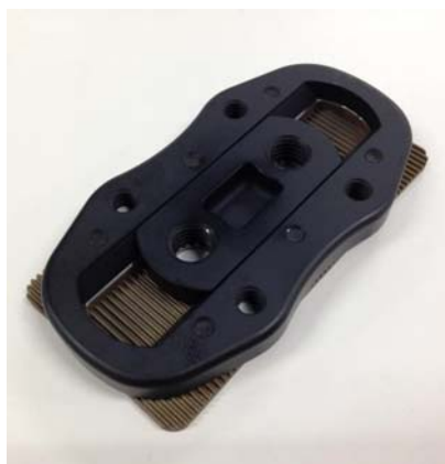
図 3 スライドコネクタ

スポーツ用義足完成後でも全長を微調整することが可能なスライドコネクタを製作した。従来品に比べ、2mm薄肉化・30%軽量化することで、より幅広いユーザーに使用できるようにした。モニター評価において、義足完成後でも細やかな長さ調節ができ、確実な固定ができる点を評価頂いた。