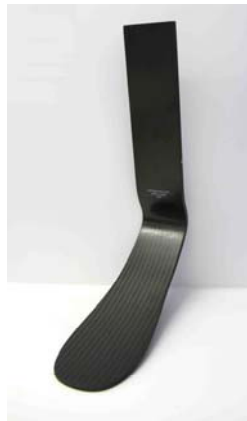
図 1 KATANA-Jr-LP