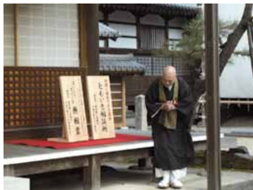
ほっこりスペース無相堂(寺を活用した居場所)