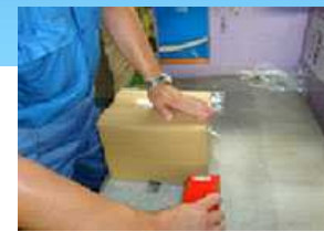
段ボール組立作業