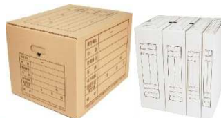
作業／梱包／ 店舗用品