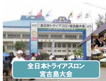
全日本トライアスロン 宮古島大会