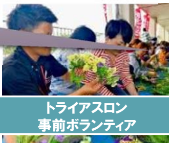
トライアスロン 事前ボランティア