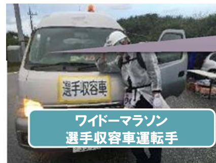
ワイドーマラソン 選手収容車運転手