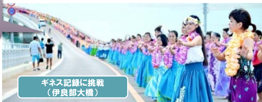
ギネス記録に挑戦 (伊良部大橋)