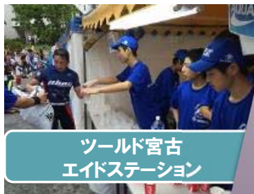
ツールド宮古 エイドステーション