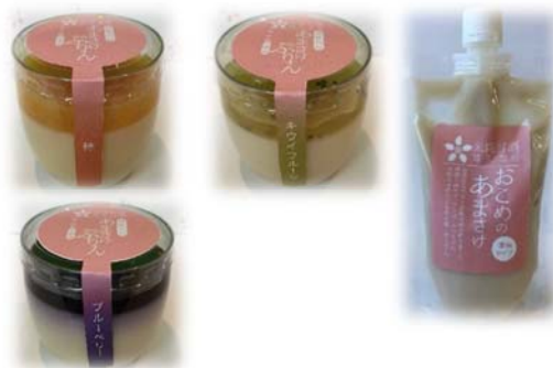
米糍甘酒の加工品