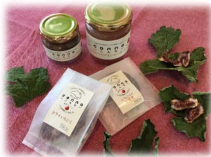
いちじくの加工品