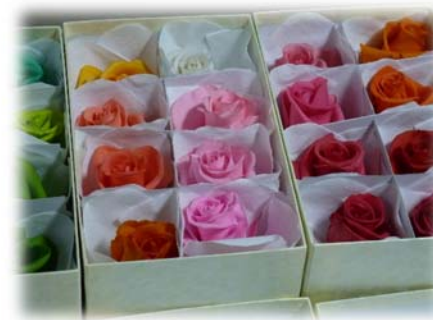
プリザーブドフラワー