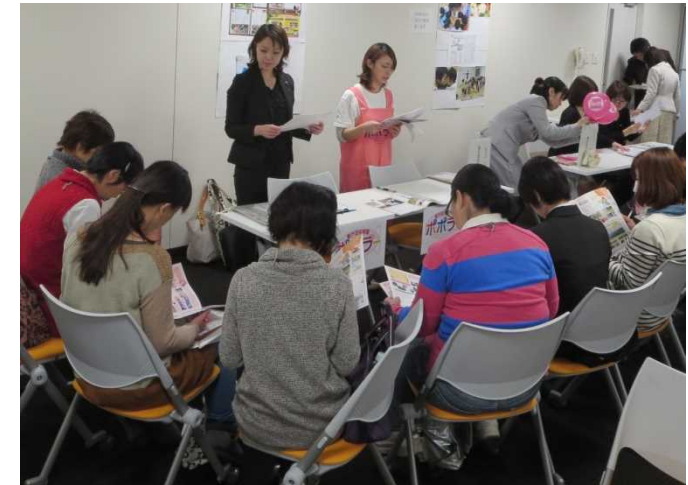
保育士セカンドチャレンジ研修(1/31)