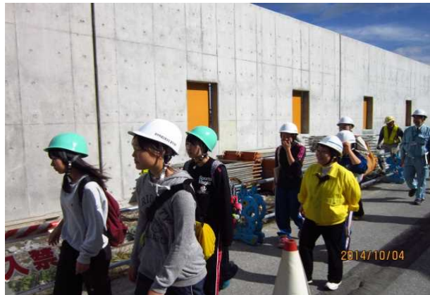
防潮堤建設現場を見学する生徒たち