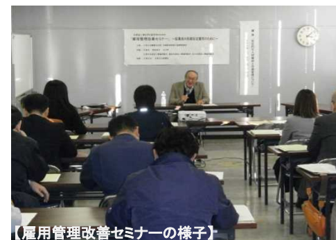
【雇用管理改善セミナーの様子】