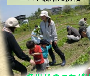
ベニバナ栽培に挑戦