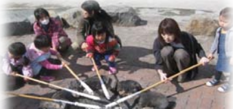
みはらし名物棒パン