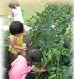
ミニトマトみつけ