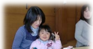
ママに抱っこでご機嫌