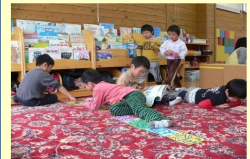
自由気ままに楽しんでいます