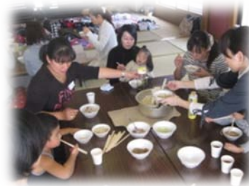
避難者サロン・ひっぱりうどんで笑顔

「地域における人のつながりづくり」をテーマに子育て中の母親を対象に親子活動を実施してきました。東日本大震災を経験し、様々な環境や状況の親子達の理解に努め、より確かな人のつながりづくりを進めていきたいと思っています。