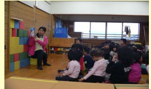
絵本の読み聞かせに夢中

折り紙では、手裏剣作りを始めると作りたいと言って作り始めるが、なかなかうまくいかず保育士に頼る子どもも。年長児ぐらいになると本をみて折り紙をおる子どもが増え、子どもの成長が見てとれる。