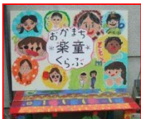
みんなで作った楽童の看板

中年世代の再就職希望の女性を中心に雇用し、地域と子どもを結ぶ地域コーディネーターと学童スタッフの育成に取組ました。