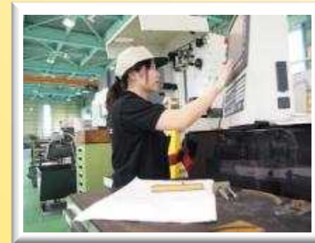
ものづくり業界の “なでしこ”たち（イメージ）