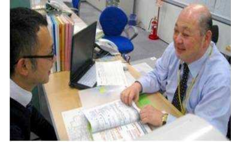
担当者制による個別支援の実施 (わかものハローワーク)