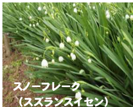
スノーフレーク (スズランスイセン)