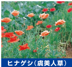
ヒナゲシ(虞美人草)