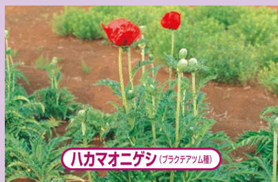
ハカマオニゲシ(プラクテアム種)