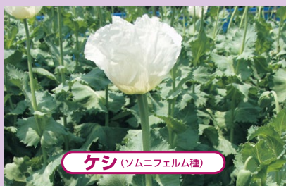
ケシ(ソムニフェルム種)