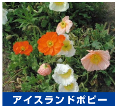
アイランドポピー