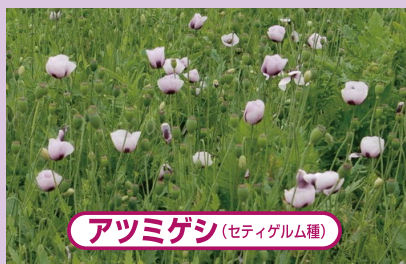
アツミゲシ(セティゲルム種)

花びらは4枚で、色は赤、桃、紫、白などがあります。また、多数の花びらがついた八重咲きの花もあります。