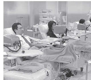
神戸・三宮センタープラザ献血ルームで 血の橋（1月27日から「ミント神戸」115