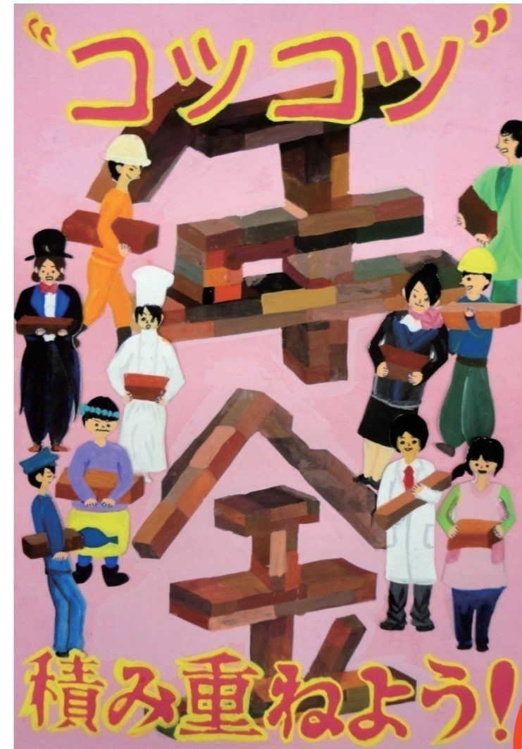
山形県年金ポスターコンクールより

自分が老後受け取る年金の額は、現役時代にどれだけ老後世代を支えたか(加入期間や支払った保険料)に応じて決まる仕組みになっています。