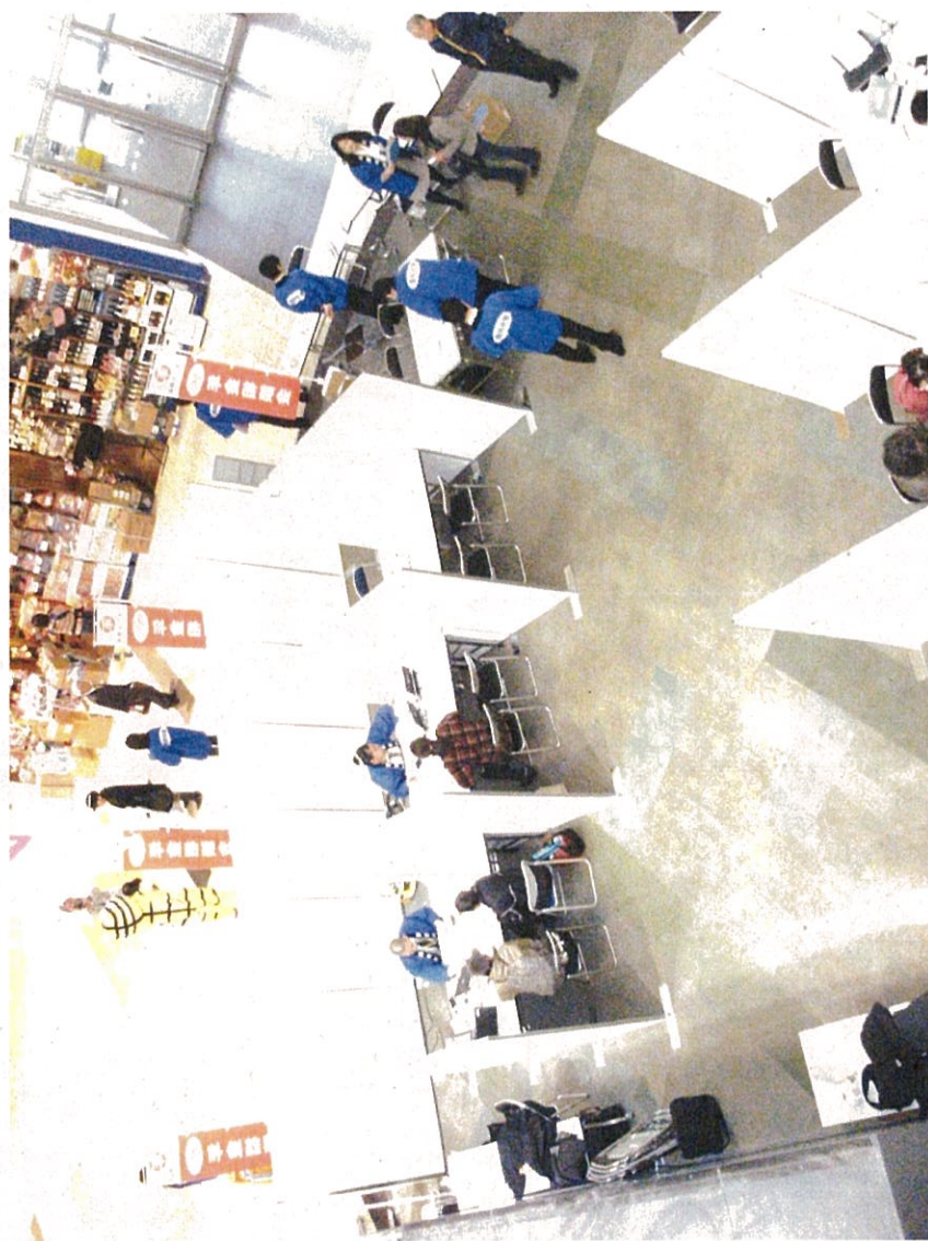
関西大型商業モールでの出張相談

「ねんきんネット」のポスターの掲示、リーフレットの配布、利用の呼びかけ、使い方の説明等（年金事務所、年金相談センター等に協力を依頼）