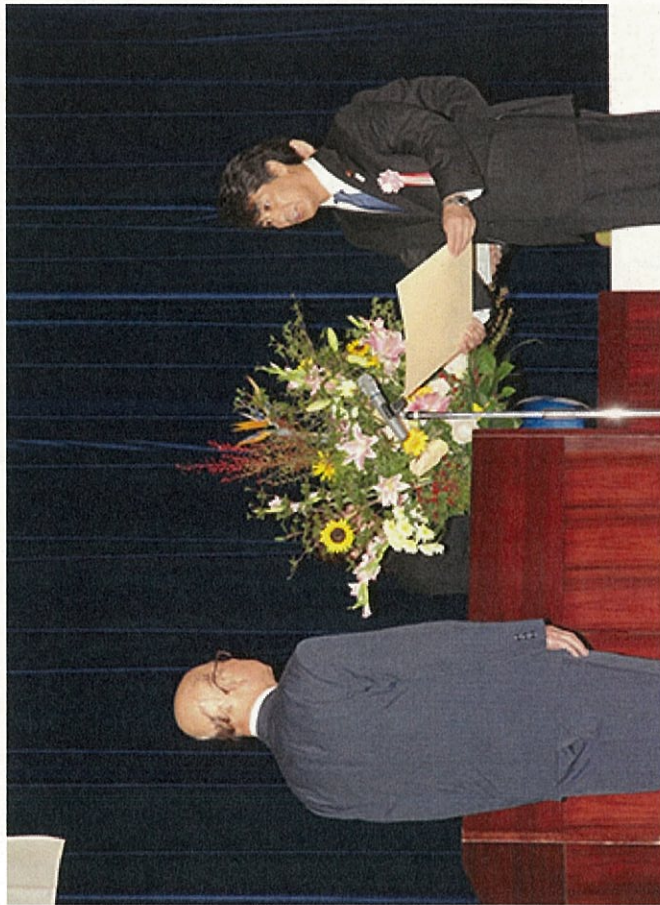
写真は救急医療功労者厚生労働大臣表彰の時のもの

「わたしと年金エッセイ」(公的年金の大切さ、応募者ご自身や身近な方と公的年金との関わりなど、「わたしと年金」をテーマにしたエッセイ)について、今年度から「厚生労働大臣賞」を新設。