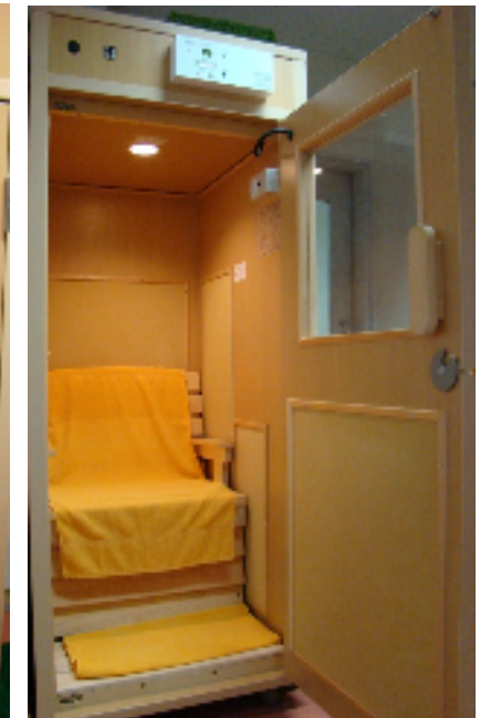
毛布による30分間の安静保温