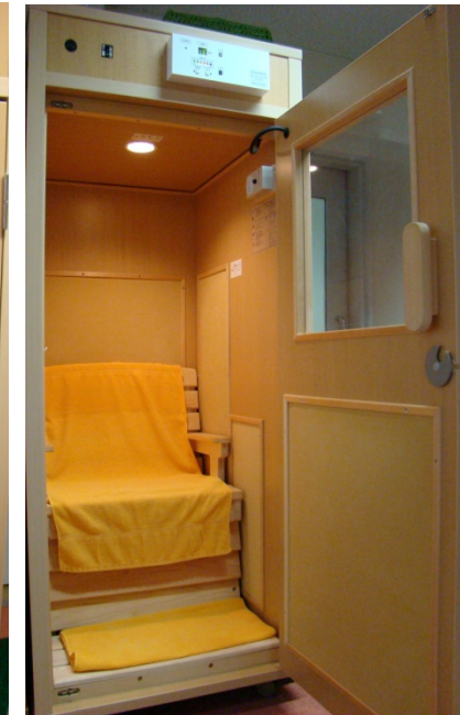
毛布による30分間の安静保温