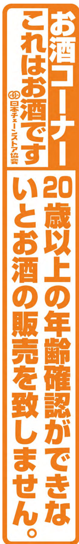
(3) 仕切版 700×100・両面