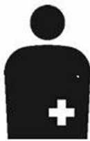
【オストメイトマーク】 所管：公益社団法人日本オストミー協会