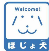
【ほじょ犬マーク】 所管：厚生労働省社会・援護局障害保健福祉部