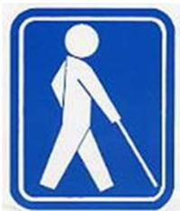
【盲人のための国際シンボルマーク】 所管：社会福祉法人日本盲人福祉委員会