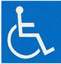
【障害者のための国際シンボルマーク】 所管：公益財団法人日本障害者リハビリテーション協会