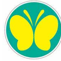
【聴覚障害者標識】 所管：警察庁