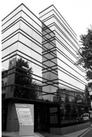
▲(株)日本レーザー東京本社