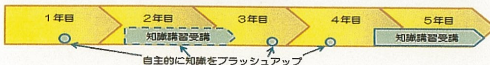
知識講習のモデル受講例

知識講習は、その知識をブラッシュアップするという観点から、更新を行う直前の概ね1年の間に受講することが望ましいものですが、これ以外のタイミングでも、その時点での最新情報を把握するために同講習を受講することはむろん妨げられませんし、これ以外の方法、具体には厚生労働省ホームページや指定登録機関の情報を確認する等により、労働法令等の最新知識を常に把握しておくことが望まれます。