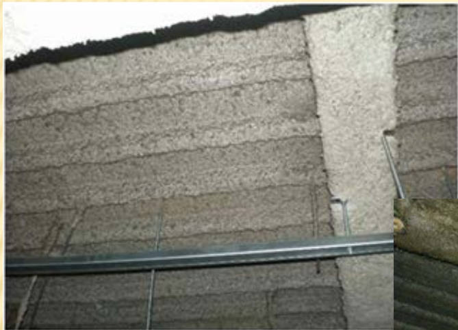
アスベスト含有吹付け