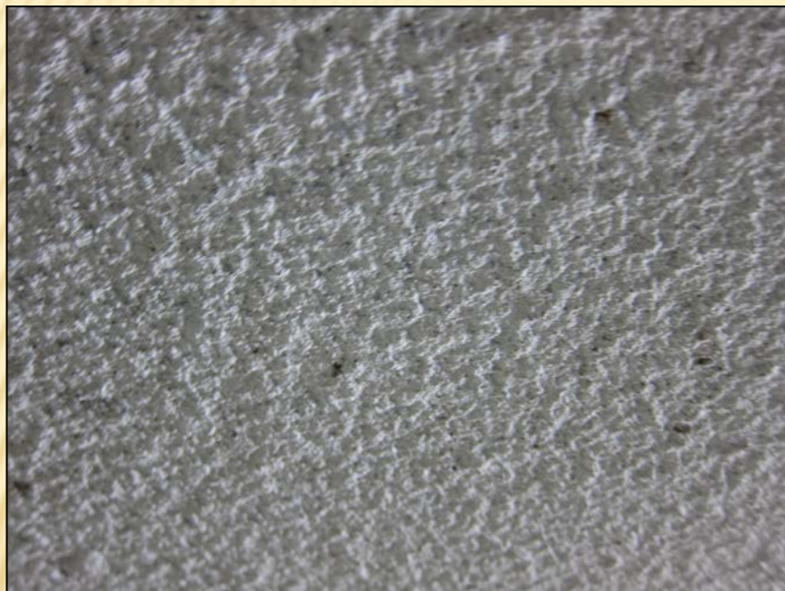
バーミキュライト吹付け