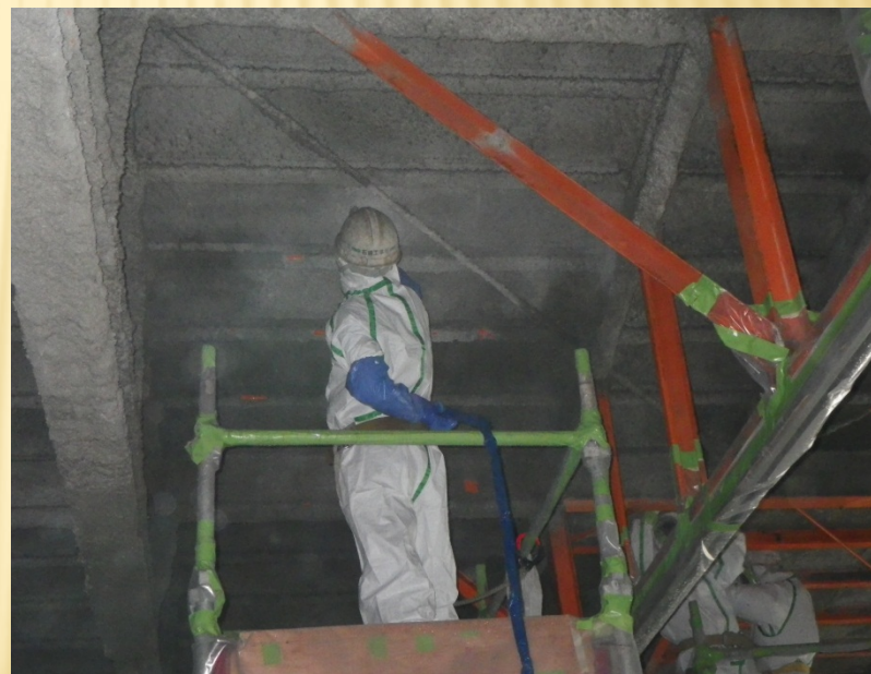
ホール天井裏 薬液吹付け中