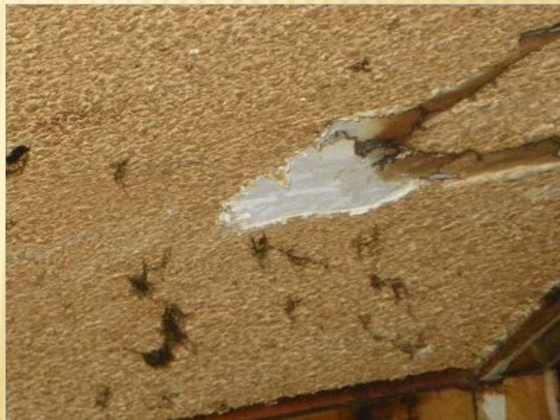
バーミキュライト吹付け