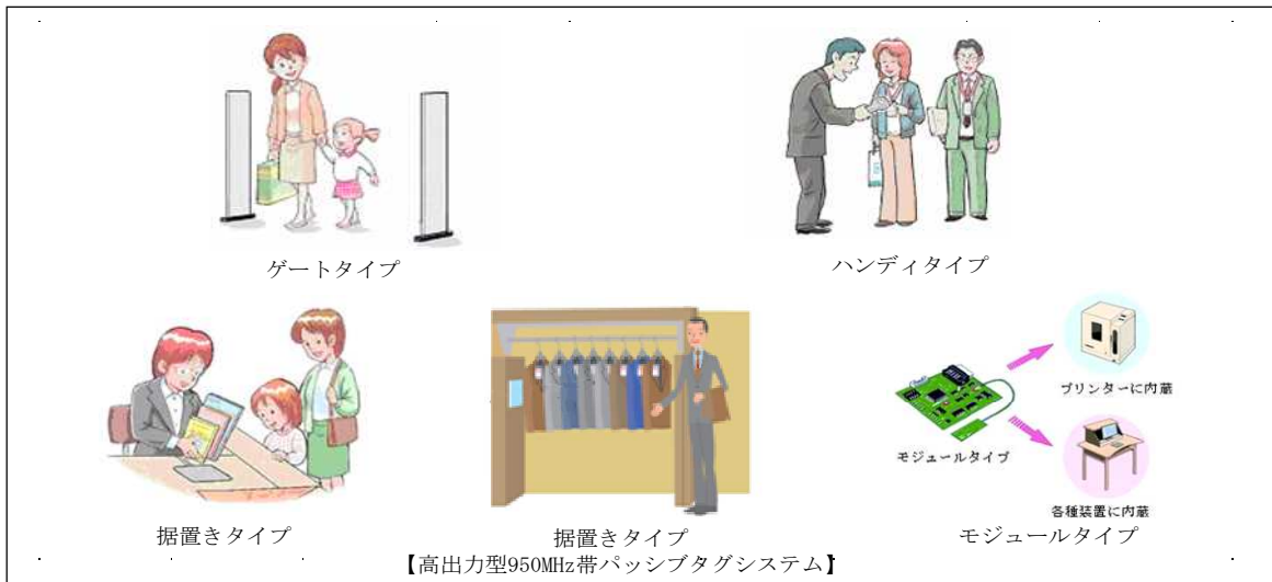
図4 各タイプのRFID機器

注3： 比較的長距離の通信が可能なUHF帯（950MHz帯）の電波を利用するRFID機器。 例えば、コンテナやパレットなどに貼付したタグの一括読み取り等のアプリケーションに使用されることが想定される。