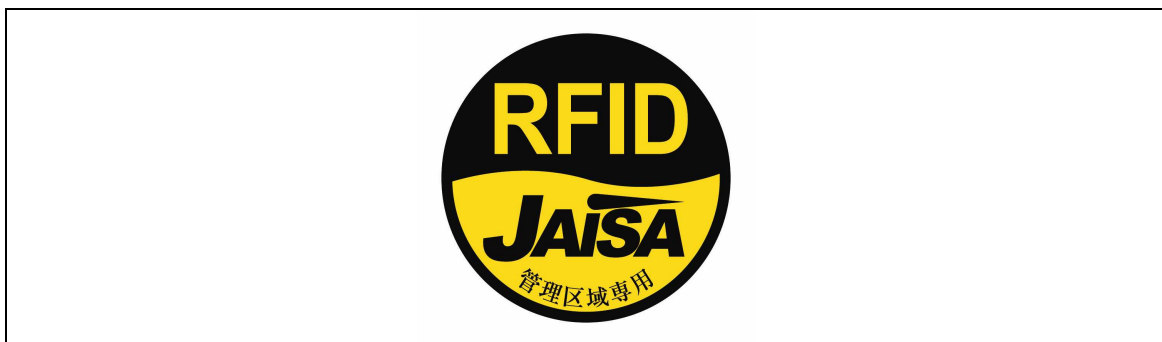
図3 管理区域専用RFID機器用ステッカー

注1： ここでは、公共施設や商業区域などの一般環境下で使用されるRFID機器を対象としており、工場内など一般人が入ることができない管理区域でのみ使用されるRFID機器（管理区域専用RFID機器）については対象外としている。なお、管理区域専用RFID機器については、（一社）日本自動認識システム協会において、一般環境への流出を防止するため、取扱説明書等に注意書きを記載するとともに、管理区域専用RFID機器用ステッカー（図3）を貼付することとされている。