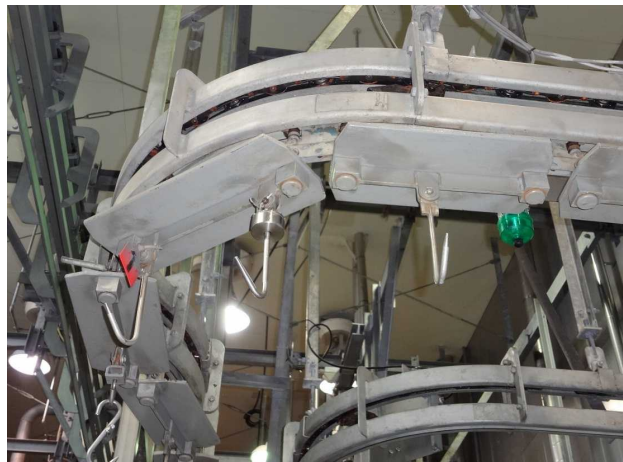
機械等の耐蝕・防錆処理①