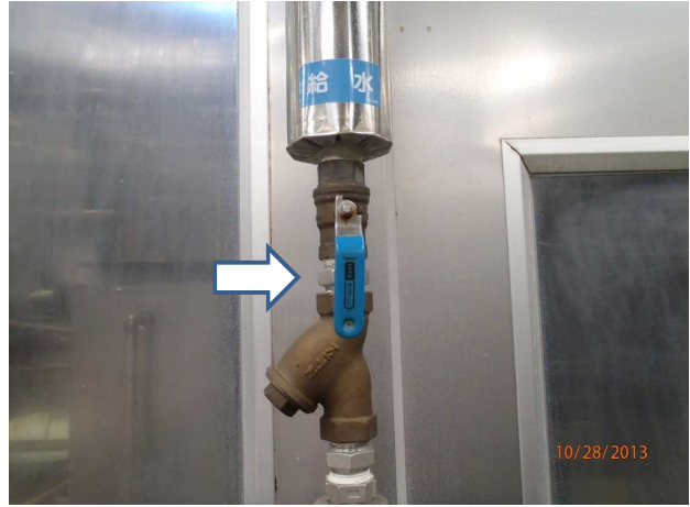
逆流防止弁の設置