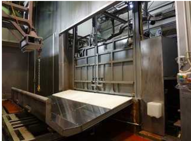
放血前区域のドライ化①