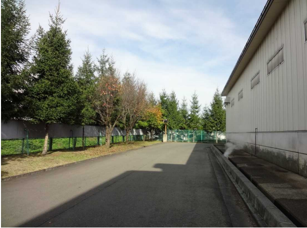
施設外周の舗装及び排水溝の設置