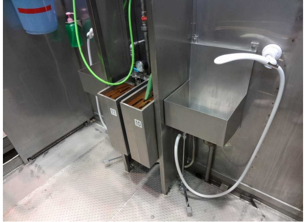
足踏み式手洗設備