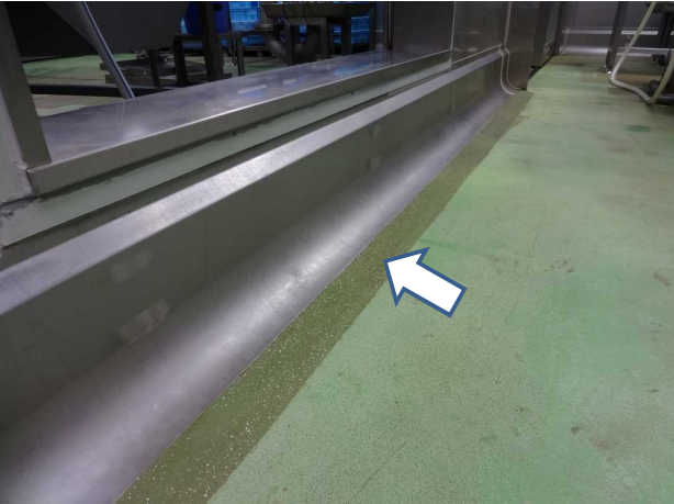
内壁と床のアル構造