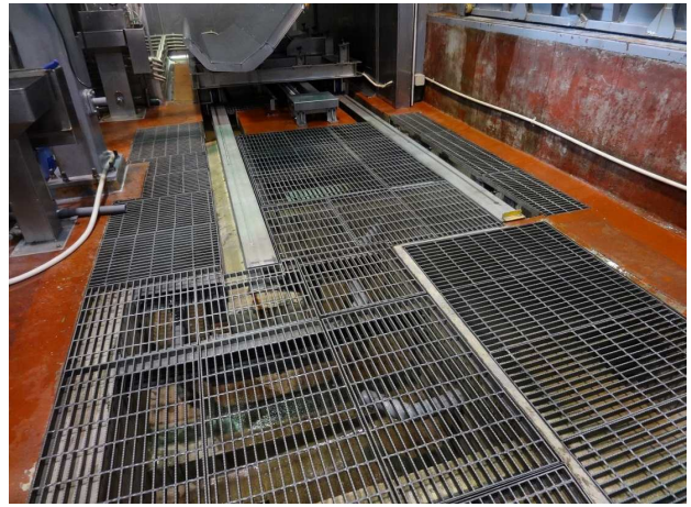
放血前区域のドライ化②