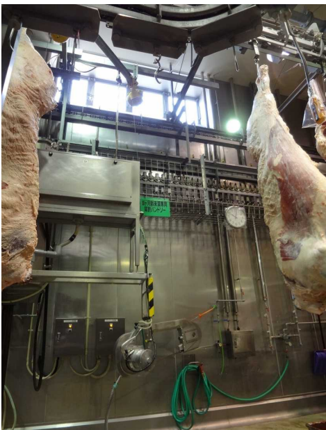
窓の高さ(床面から0.9 m以上に設置)