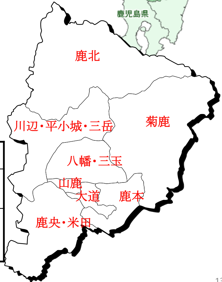
管内の保健師の状況(26年度)