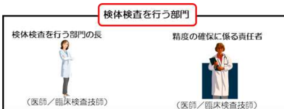
(図3-1) 精度の確保に係る責任者の配置

* 精度の確保に係る責任者は、歯科医療機関の場合、歯科医師又は臨床検査技師、助産所の場合、助産師とする。