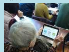
介護予防、生活支援、健康管理に活用！