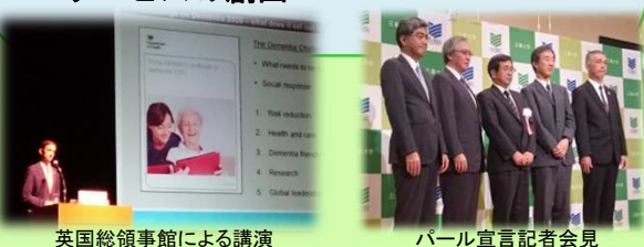
英国総領事館による講演