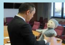
テレノイドを活用した遠隔操作による会話型見守り