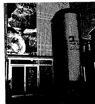
店の外観。大きな看板でエステメニューをアピールしている

古くから全身エステを提供してきた同店ではあるが、BBエステから学ぶことも多く、既存技術に取り入れて品質の向上を図っており、「メンズBBエステティ