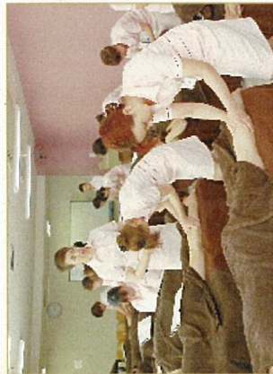
● 全国理容連合会 B8エステティック購買員

「理容室だからできること、理容室ならではの強みを活かして、新しいマーケットを切り拓いていく」「B8エステティック」は、お客様一人ひとりの気持ちに寄り添い、その方に応じたきめ細かなサービスを提供していくことを目指しています。「そのお客様だけの特別なもの」を提供する空間づくり、新しい“Barbershop”のカタチをご提案いたします。」