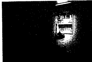
エステルーム。このほかにベッド2台の部屋を新設した