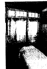
香り、音、照明などで非現実感を演出したエステルーム

「都会ではないので、全身エステが何人くらいのお客様にご利用いただけるのか心配もあったんですけど、『えっ、この方が?』と感じるような方にもご利用いただけます」と語るのはヘアサロン