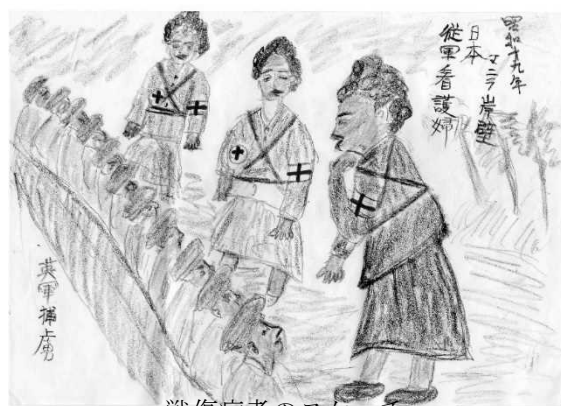
戦傷病者のスケッチ