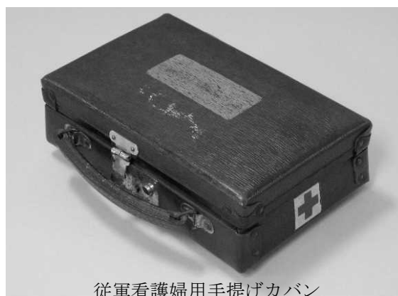
従軍看護婦用手提げカバン