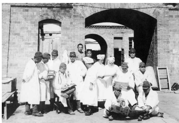
衛生兵や傷病兵と共に写る従軍看護婦