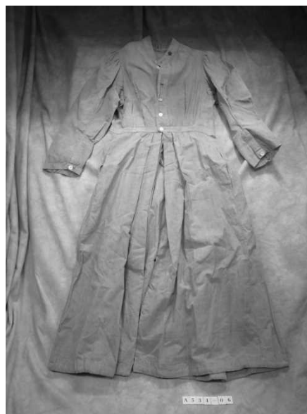
陸軍病院配属時の制服