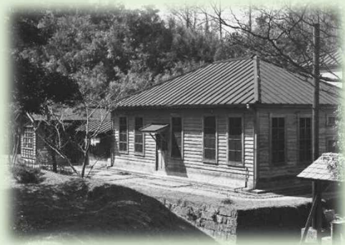
野口英世が細菌検査に従事した 細菌検査室