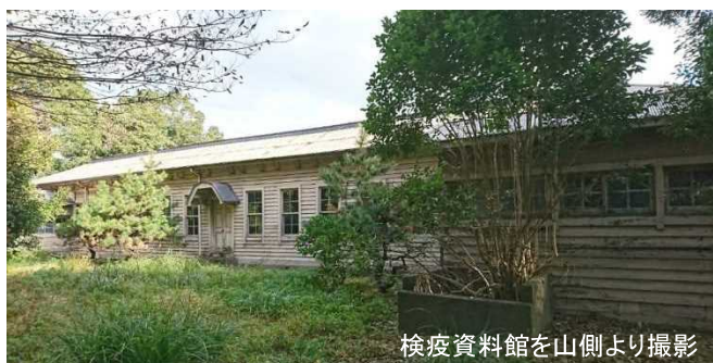
検疫資料館を山側より撮影

お問合せ先:横浜検疫所総務課 横浜市中区海岸通1-1 (横浜第二港湾合同庁舎) TEL 045-201-4458 / Fax 045-201-3302