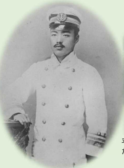
検疫医官補時代の野口英世