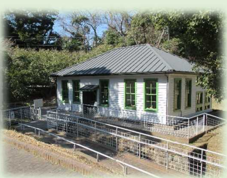
平成9年(1997年)5月にオープンした野口記念公園内に復元された細菌検査室