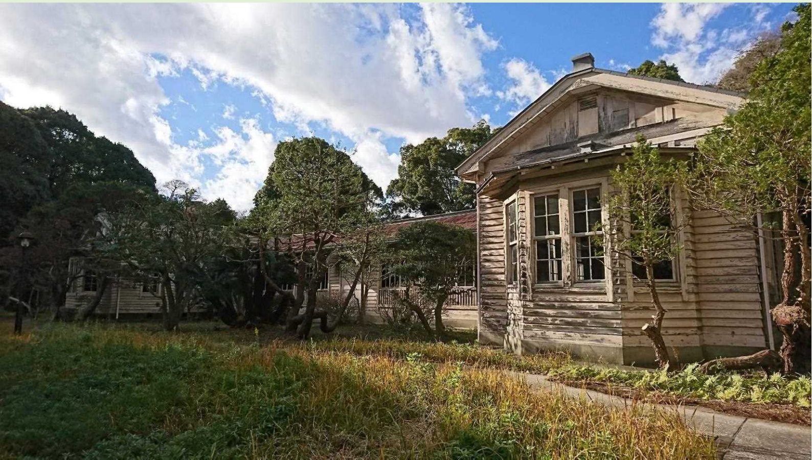
検疫資料館を海側より撮影