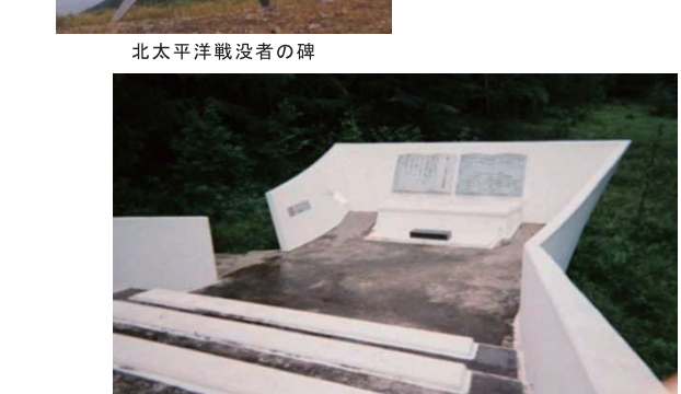
樺太・千島戦没者慰霊碑