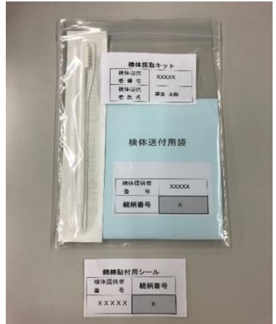
検体採取キット（御遺族用）

DNAサンプルは検体採取キットに同封されている、「検体採取要領」に従い、ご自身の頬（口の内側）の粘膜を採取していただきます。