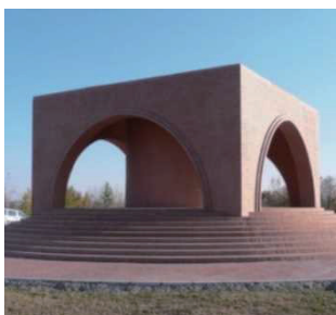
日本人死亡者慰霊碑（ロシア）