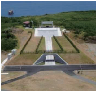
硫黄島戦没者の碑