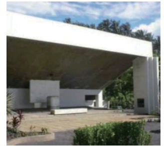
南太平洋戦没者の碑