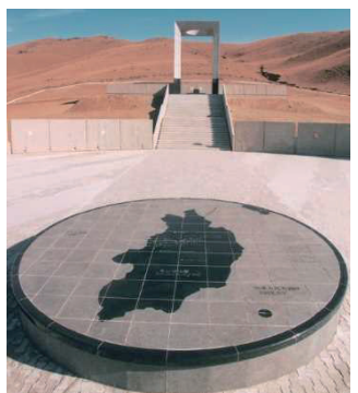
日本人死亡者慰霊碑（モンゴル）