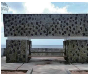
西太平洋戦没者の碑