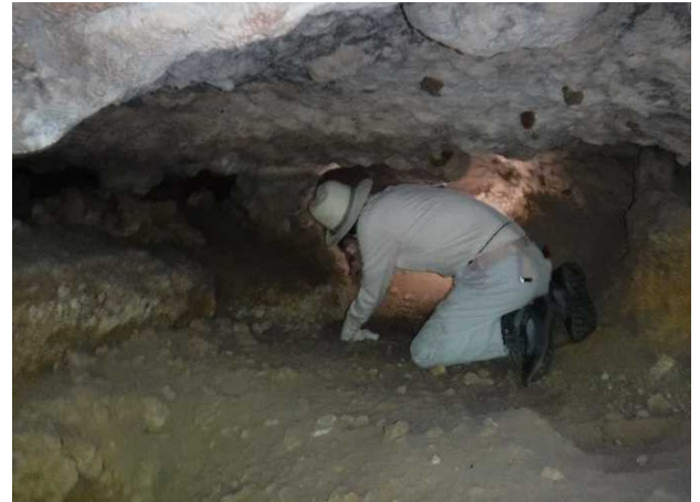
遺骨収容（マリアナ諸島）