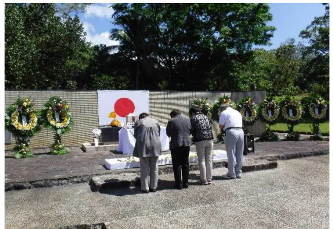
現地慰霊（フィリピン）