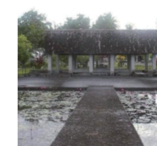
ニューギニア戦没者の碑