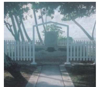
東太平洋戦没者の碑