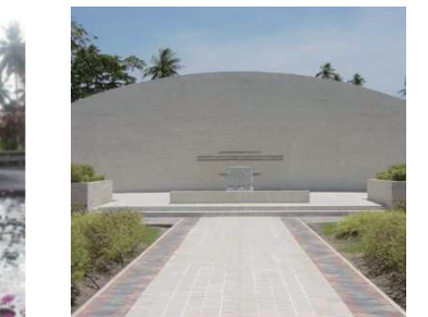
ボルネオ戦没者の碑