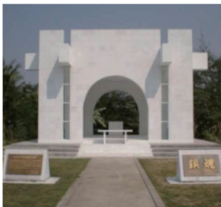
ビルマ平和記念碑