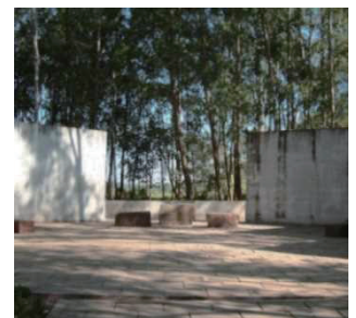
インド平和記念碑