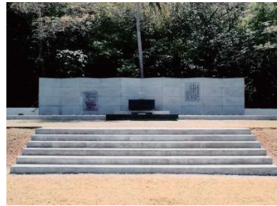
中部太平洋戦没者の碑