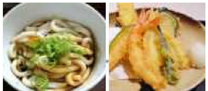
Menú para los visitantes de religión islámica