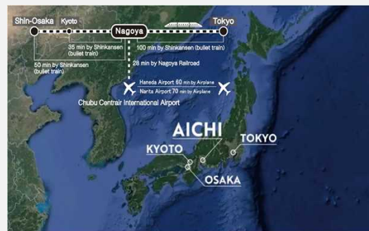
Ubicación de Aichi