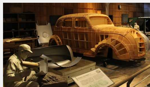
Museo Conmemorativo de Industria y Tecnología de Toyota