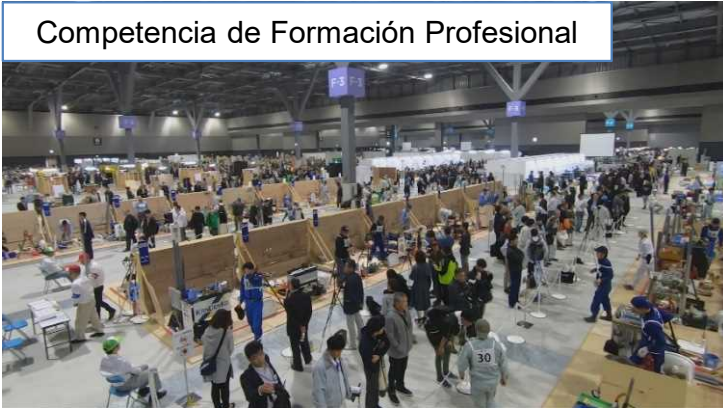
Competencia de Formación Profesional