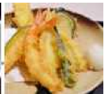
Beispiel eines Menüs für muslimische Besucher