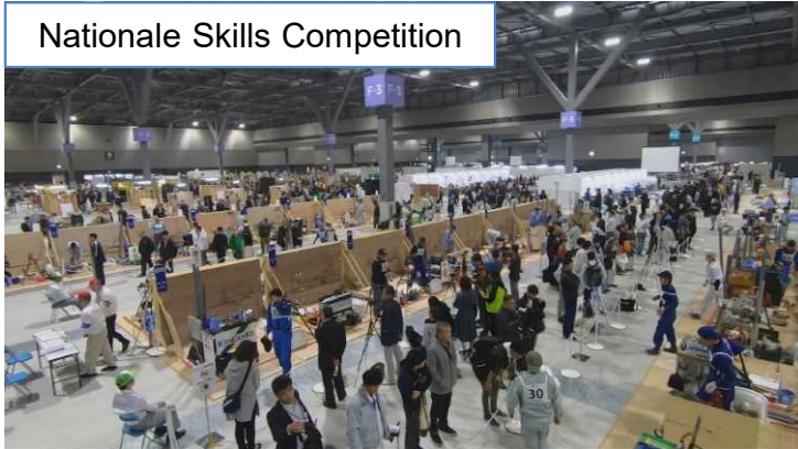
Nationale Skills Competition