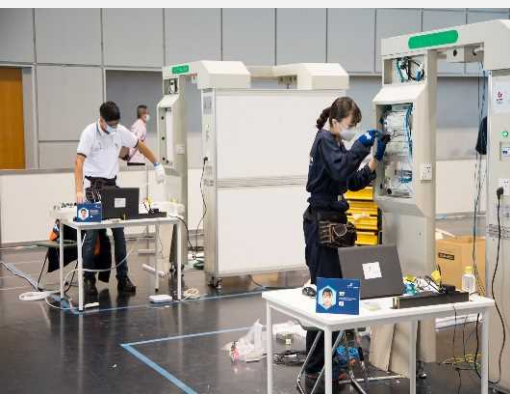
„Berufssparte Photoelektronentechnik“ an der 46. WorldSkills Competition (in Kyoto)