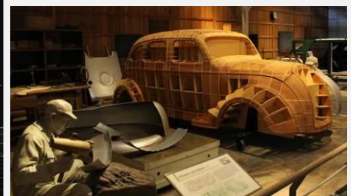
Toyota Commemorative Museum of Industry and Technology