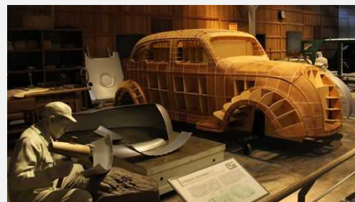
Museu Comemorativo da Indústria e Tecnologia da Toyota