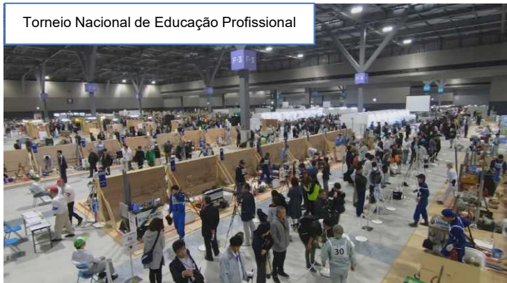
Torneio Nacional de Educação Profissional