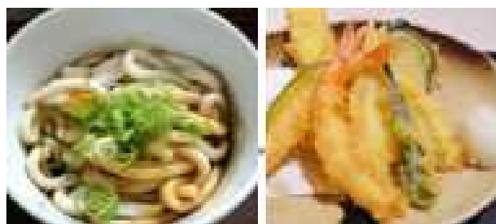
Exemplos de cardápios para turistas muçulmanos