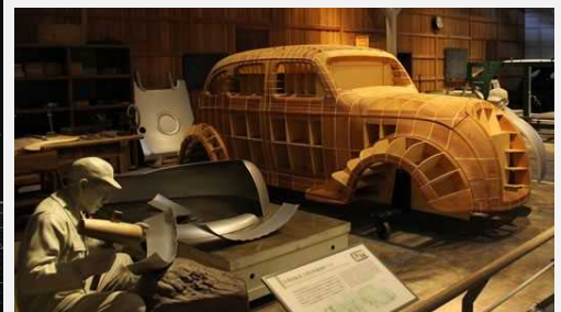
Musée Commémoratif de l'Industrie et de la Technologie de Toyota