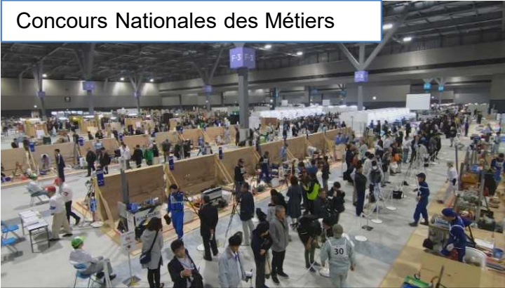
Concours Nationales des Métiers