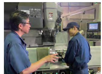
▲長年の経験・技術の伝承

社員一丸となり苦戦しながら ISO14001、ISO9001 を同時取得することが出来たことは、会社全体の向上にも繋がり、安心・安全をお客様にお届けできる証として誇らしく思います。また新たに入社してくれるであろう人材に関しても、自信をもって自社をアピールすることができます。また何より、大手企業様からの問合せが一段と多くなりました。社内熟練工による長年の経験や技術を若い社員へ伝承し、また積極的に外部のノウハウを取り入れることで、会社全体のレベルアップに繋がっています。技術・品質・情報の共有化が図れている為、モチベーションもアップし社員の「人間力」も更に向上しています。