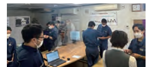
▲自由参加の勉強会（月1回開催）