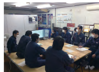
▲勉強会によるモチベーション向上

コロナウィルス感染拡大により、製造業を取り巻くサプライチェーンの寸断、需要の減退等厳しい状況が続き、仕事量が減少した2020年でしたが、「ピンチをチャンスに!」と、その期間を学び・蓄積期間と捉え、ISOメンバー4名が主体となりISO14001、ISO9001を同時取得しました。取得までの過程では、社員全員で勉強会を実施、また当社の協力会社様にも勉強会に参加してもらい品質の平準化を図り、より一層の顧客満足度向上の為、社内外でコミュニケーションの強化及び厳しい時代のモチベーションアップに繋がりました。少子高齢化によって製造業に関わる人口が減少していく中、技術系パート社員等、幅広い人財を雇用していく予定です。