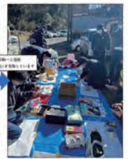
▲社内の SDGs 活動