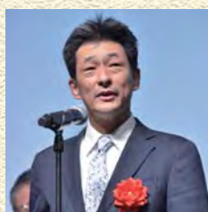
伊藤忠テクノソリューションズ株式会社