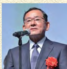
日鉄工材株式会社