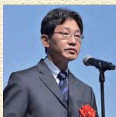
コニカミノルタウイズユー株式会社