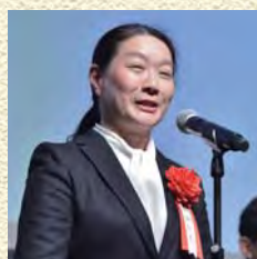
日本電産株式会社