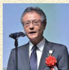
日本生命保険相互会社