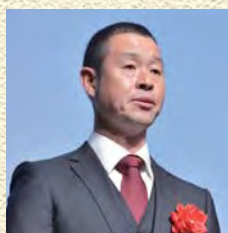
服部農園有限公司