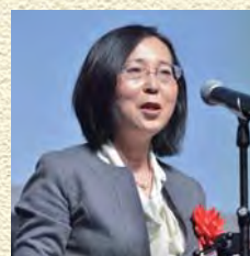
三菱ケミカル株式会社