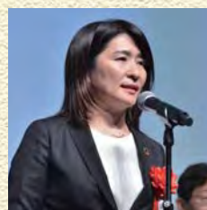
三井住友海上火災保険株式会社