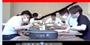
再開した集合研修