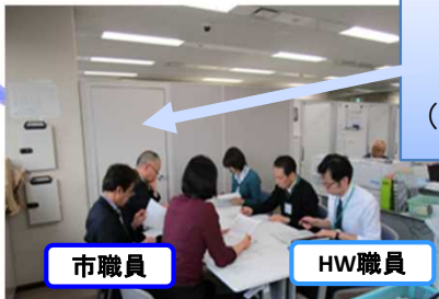
扉の向こう側には すぐに常設窓口 (支援調整会議の風景)