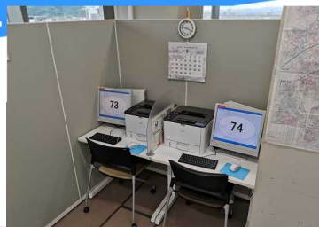
常設窓口での相談風景

支援当初は持病を理由に就職活動に積極的な姿勢が見られなかったが、過去の失敗による本人の不安を取り除き自信を持たせるという共通の目標を設定し、連携支援に取り組んだ結果、就労意欲に高まりの変化が見られ、就職し保護廃止に繋がった。