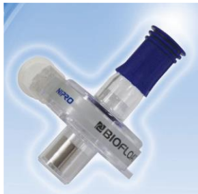
動圧浮上・非接触回転方式 長期耐久性・抗血栓性遠心ポンプ BIOFLOAT NCVC