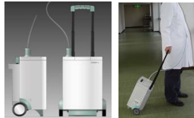
携帯型VAD駆動装置 Mobart NCVC