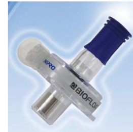
非接触回転方式遠心ポンプ BIOFLOAT NCVC