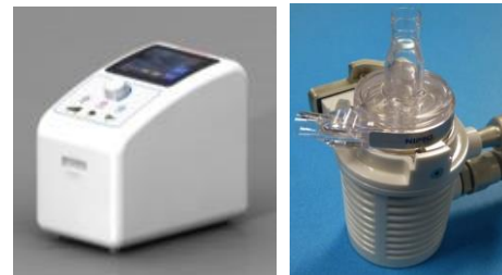
非接触回転方式遠心ポンプ BIOFLOAT NCVCによる 体外設置型 超小型高性能連続流式VAD →小児・成人の急性重症心不全 治療に大きく貢献する可能性