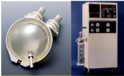
NCVC型体外設置型 拍動流式VAD