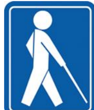
【盲人のための国際シンボルマーク】 所管：社会福祉法人日本盲人福祉委員会