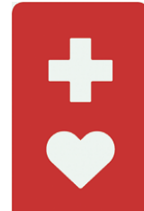
【ヘルプマーク】 所管：東京都