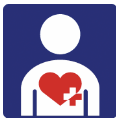
【ハート・プラスマーク】 所管：特定非営利活動法人ハート・プラスの会