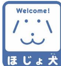
【ほじょ犬マーク】 所管：厚生労働省