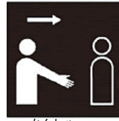
かんしゃ 感謝する