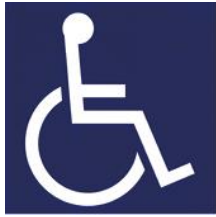
【障害者のための国際シンボルマーク】 所管：公益財団法人日本障害者リハビリテーション協会

れいわ ねんぽん しょうがいしゃはくしょ ないかくふ 「令和5年版 障害者白書」(内閣府)より