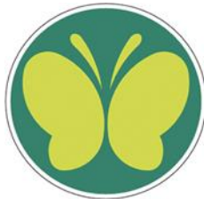
【聴覚障害者標識(聴覚障害者マーク)】 所管：警察庁