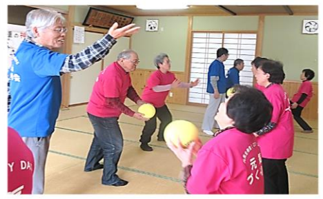
元気づくり会の様子

【通いの場「元気づくり会」とは】 町内会単位で身近な集会所等を活用して、はじめの6か月間をコーディネーター(市職員)とともに元気づくり体験で身体を動かし、「元氣になりたい、元氣でいたい」という健幸意識の醸成を図る。7か月目からは、参加者たちが元気づくり会を楽しみながら主体的に継続している。